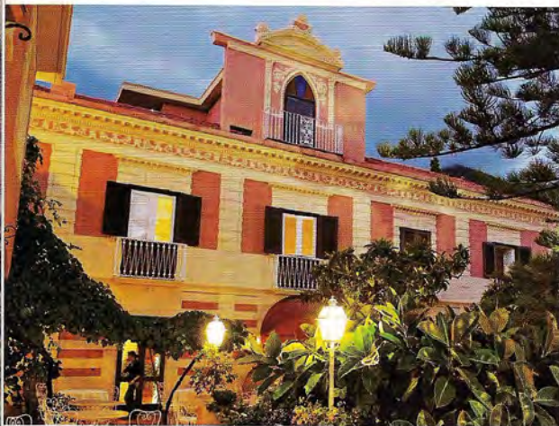
6 Villa Cheta

Una dimora di fine Ottocento nei pressi di Teramo. Tra pini marini e palme secolari, con vista sul mare. La villa vanta interni eleganti, ma è lo spazio esterno, immerso nella natura, l'ideale per un ricevimento. villarossi.it .