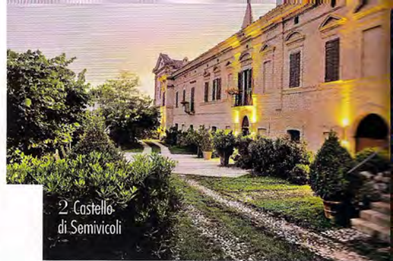
2 Castello di Semivicoli

Un vero luogo di culto che trasmette una grande spiritualità. Come allestirla? Con semplici fiori di campo. Tel. 0984.991825 .